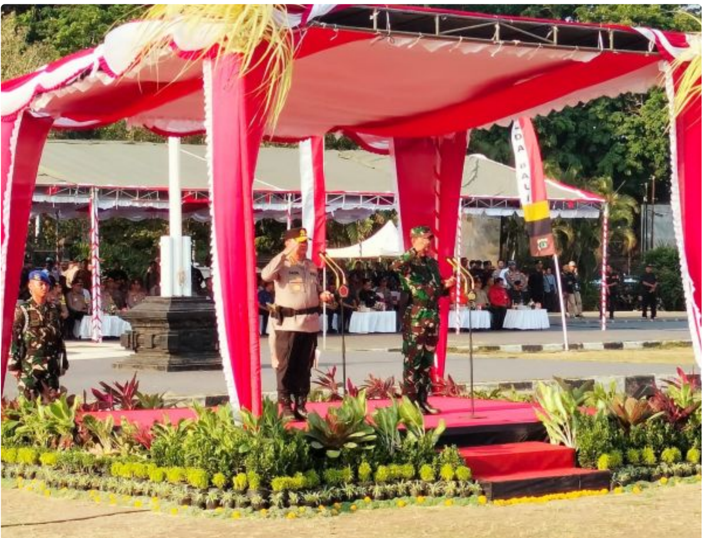
Sinergitas TNI-POLRI dan Masyarakat Bali

ALI - Polri bersama TNI telah menyiapkan pengamanan penyelenggaraan Konferensi Tingkat Tinggi (KTT) Archipelagic and Island State (AIS) Forum 2023 yang akan digelar di Bali pada 10-11 Oktober 2023.